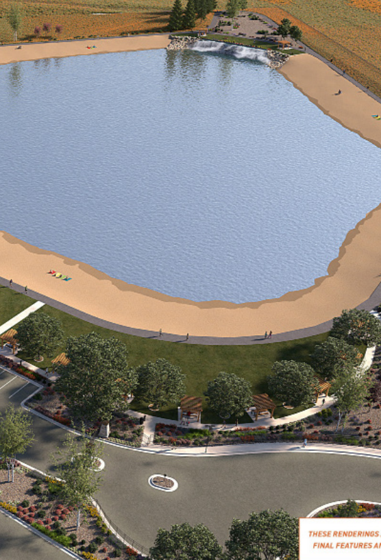
THESE RENDERINGS / FINAL FEATURES AN